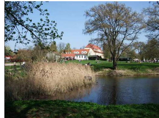
außerhalb des Wettbewerbs. Veröffentlicht am 15.4.2009 über Panoramio.com